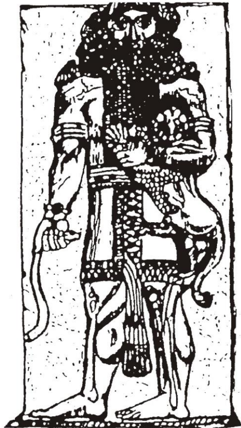
NIMROD, nach Gen. 10.8 ff der größte Herrscher und der gewaltigste Jäger vor dem Herrn