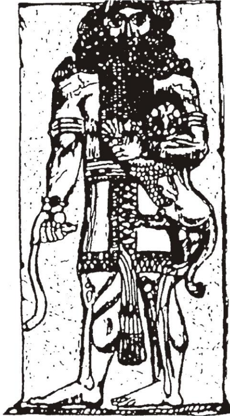
NIMROD, nach Gen. 10.8 ff der größte Herrscher und der gewaltigste Jäger vor dem Herrn